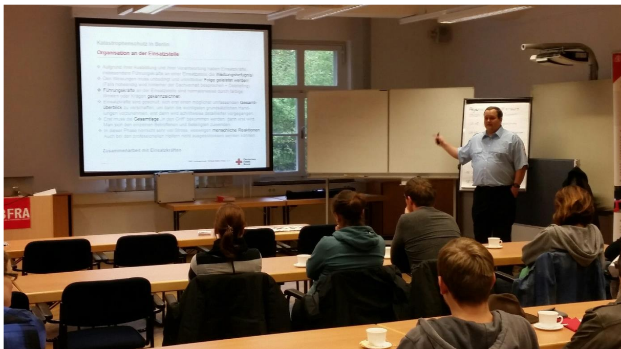
Abb. 4: Mithelfende beim Training in der BFRA

In Vorbereitung eines Mithelfertrainings vor der ersten Vollübung erstellten die Projektmitarbeiter der Berliner Feuerwehr Ausbildungsinhalte, kontrollierten Zuarbeiten von anderen Partnern und finalisierten das Ausbildungskonzept. Zudem wurden gemeinsam mit dem DRK Ausbilder rekrutiert bzw. ein Ausbilder durch die Berliner Feuerwehr selbst gestellt. Durch personelle Umstrukturierungen bei dem Leiter des AP7 (DRK) musste die Organisation des Mithelfertrainings am 3. Oktober kurzfristig durch die Berliner Feuerwehr mitunterstützt werden. Hier wurden sowohl die Schulungsräume und Trainingsstätten, die Ausbildungsmaterialien und die Versorgung der Lehrgangsteilnehmer gestellt.