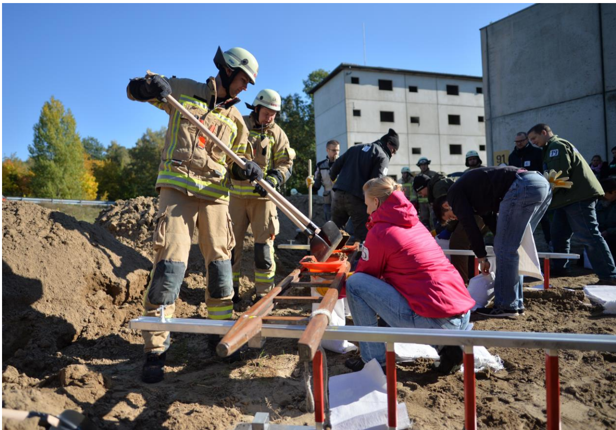
Abb. 3: Zusammenarbeit bei der Vollübung