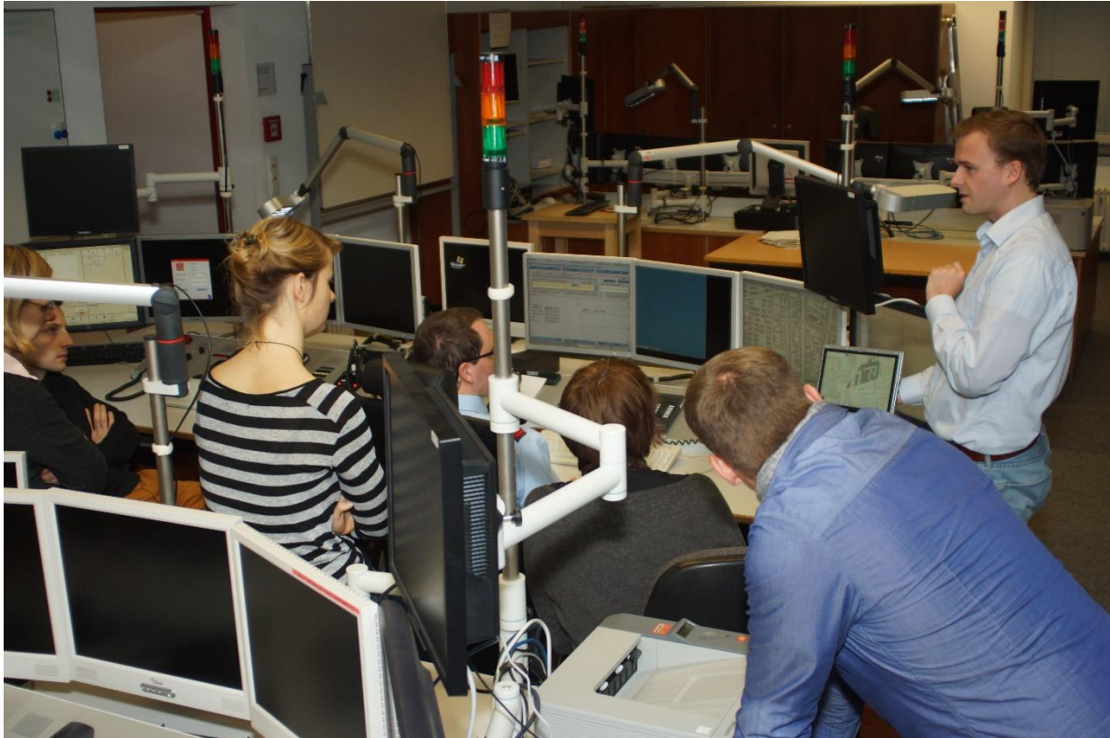
Abb. 2: Meldeübung in der Leitstelle der Berliner Feuerwehr

In Zusammenarbeit mit dem DRK wurden Teilnehmer für die Alarmierungsübungen akquiriert, Testsettings auf Basis der in AP2 entwickelten Szenarien konzipiert und schließlich die Testläufe durchgeführt. Diese Feldtests verliefen sehr erkenntnisreich. Sowohl in Hinblick auf Bedienerfreundlichkeit und Verständnis der Aufgabenstellungen konnten viele Erfahrungen gewonnen werden. Gerade die präzise Formulierung von Alarmierungstexten wurde über die gesamte Projektlaufzeit kritisch analysiert und immer wieder überarbeitet. Aber auch organisatorische Fragen zum Einsatzablauf (AP4), zu Sicherheitsmaßnahmen und Schulungen (AP7) sowie zu arbeitsrechtlichen Belangen wurden durch die Testpersonen aufgeworfen. Die gewonnenen Erkenntnisse flossen direkt in die Weiterentwicklung des Demonstrators ein und es wurden Texte, Schaltflächen und organisatorische Abläufe angepasst. Diese Evolutionsstufe des Demonstrators wurde bei der Interschutz 2015 und der ersten Vollübung eingesetzt.